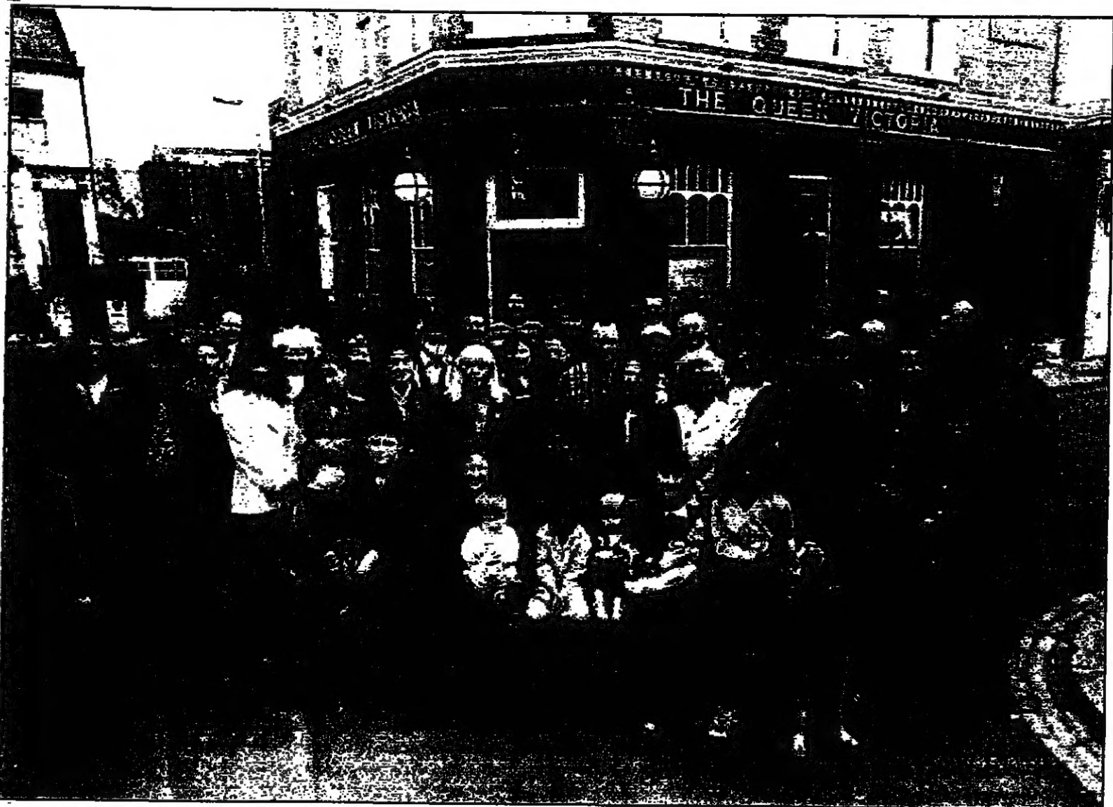
مشهد من أحداث المسلسل